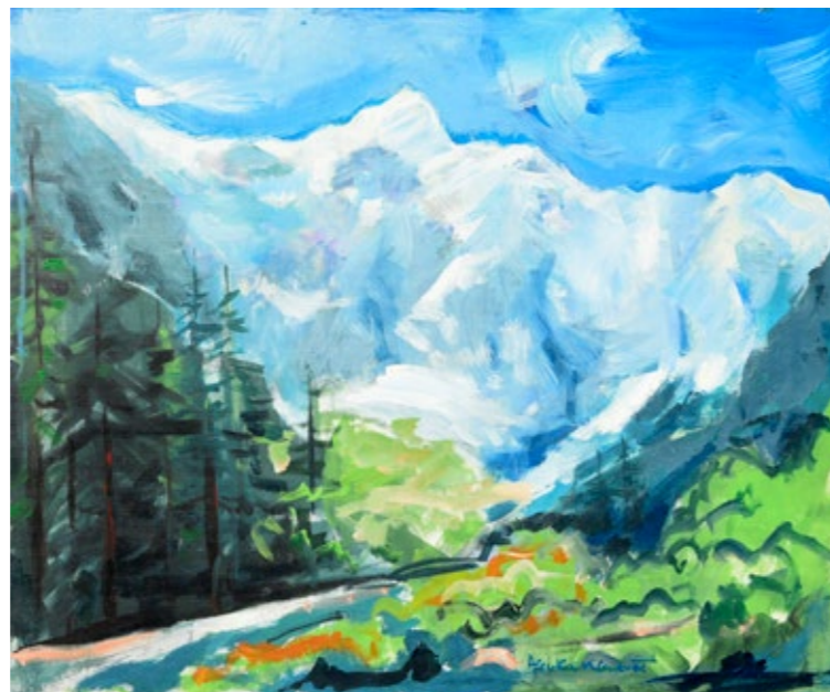
ALENKA KLEMENČIČ, TRIGLAV , akril na platno, 50 x 60 cm.