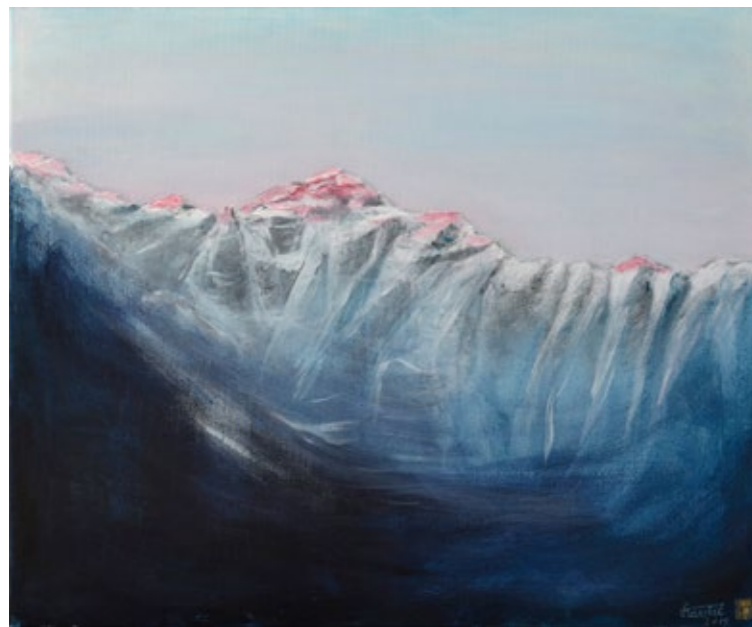
ANTON KAVČIČ, JUTRO , akril na platno, 50 x 60 cm.