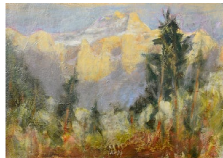
IVAN KOLAR, SEVERNA STENA , akril na vezano ploščo, 50 x 70 cm.