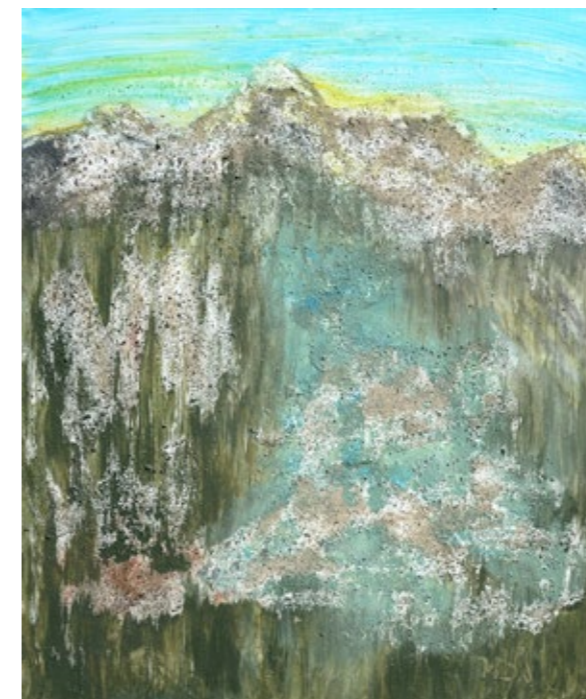
VIDA SOKLIČ, POD TRIGLAVOM , mešana tehnika na platno, 60 x 50 cm.