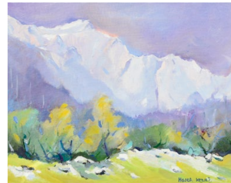
MOJCA KOVAČ, TRIGLAV , olje na platno, 40 x 50 cm.