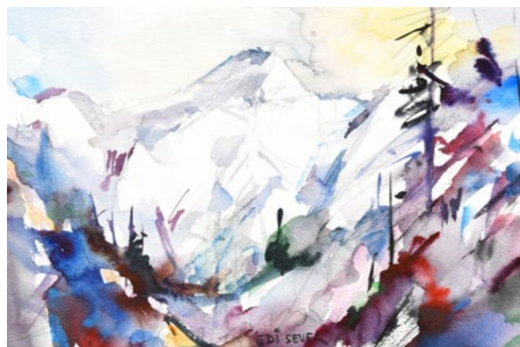
EDI SEVER, TRIGLAV , akvarel, 35 x 51 cm.