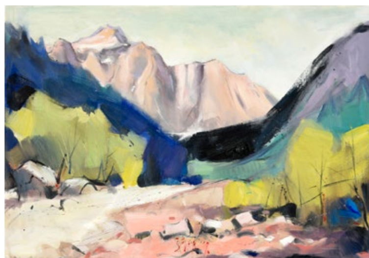
PAVLE ŠČURK, TRIGLAV , olje na platno, 50 x 70 cm.