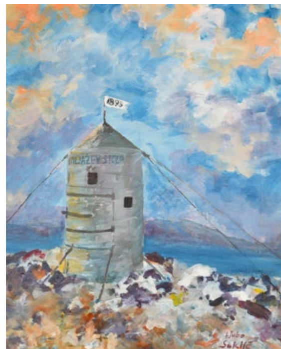
LJUBO SOKLIČ, ALJAŽEV STOLP , akril na vezano ploščo, 53 x 42 cm.