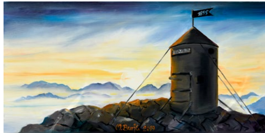
MARJAN BURJA, ALJAŽEV STOLP - SLOVO DNEVA , olje na platno, 40 x 80 cm.