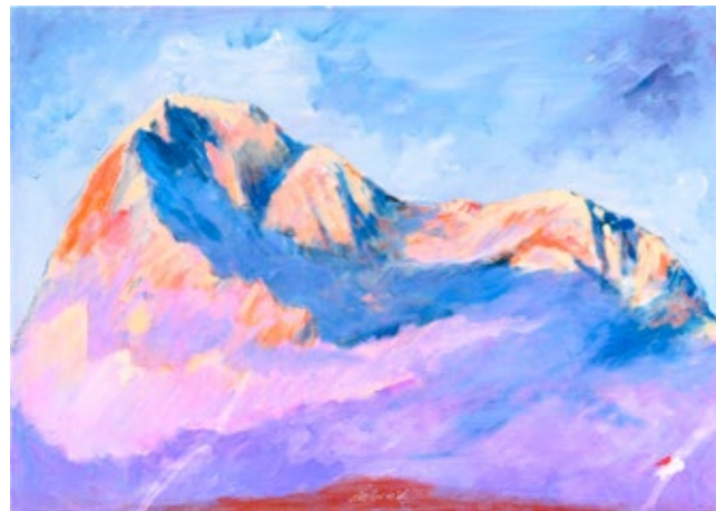
JANEZ MOHORIČ - MOKRN'K, TRIGLAV , akril na platno, 50 x 70 cm.